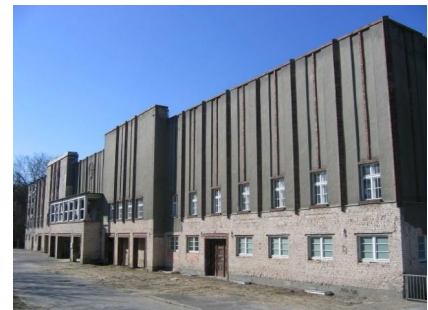
Das Gebäude vor der Sanierung