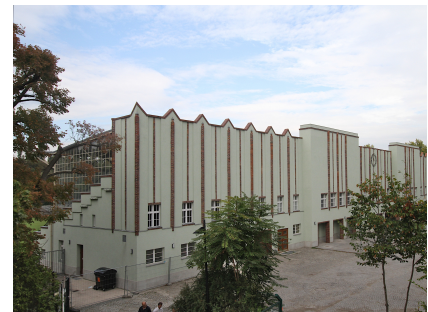
Das Tribünengebäudes mit dem Haupteingang 2014