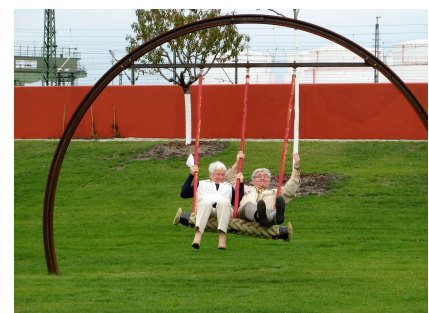
Ein Garten und Spielplatz für alle Generationen